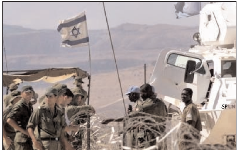
Israelische Soldaten im Gespräch mit SPUN-Truppen

Porto Novo, Benin - Einem Schiff mit 150 Liberianer, deren genauer Status noch ungeklärt ist, wurde gestern die Erlaubnis verweigert, in Porto Novo der Hafenstadt des afrikanischen Landes Benin anzulegen. SPUN-Mitarbeiter, die an Bord des Schiffes den genauen Status der Menschen feststellen wollten kamen zu spät: das Schiff hatte bereits in Richtung Nigeria abgelegt. Bereits vor einigen Monaten ereignete sich an der Elfenbeinküste ein ähnliches Szenario, als einem Schiff, das angeblich mit hunderten von Minderjährigen Flüchtlingen beladen war, von einem Staat zum anderen geschickt wurde und nirgendwo anlegen durfte.